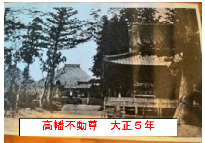
高幡不動尊 大正5年