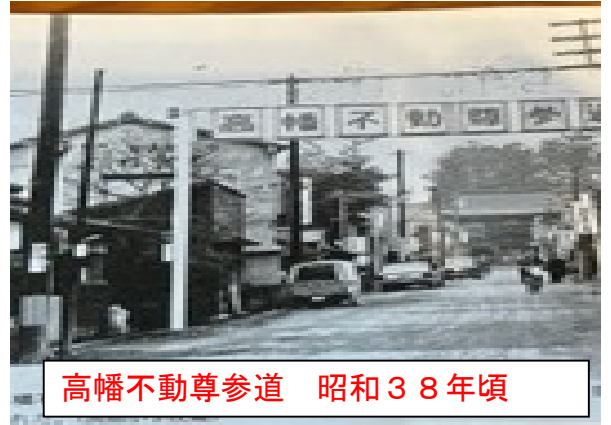
高幡不動尊参道 昭和38年頃