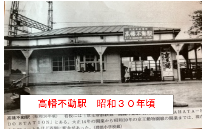
高幡不動駅 昭和30年頃